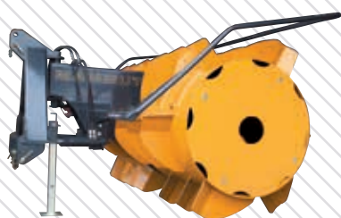
Silo Fox Gigant