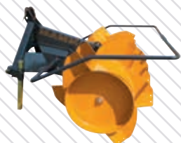
Silo Fox Classic