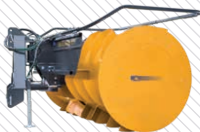
Silo Fox Koloss