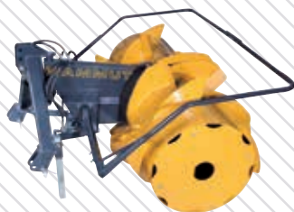
Silo Fox Titan