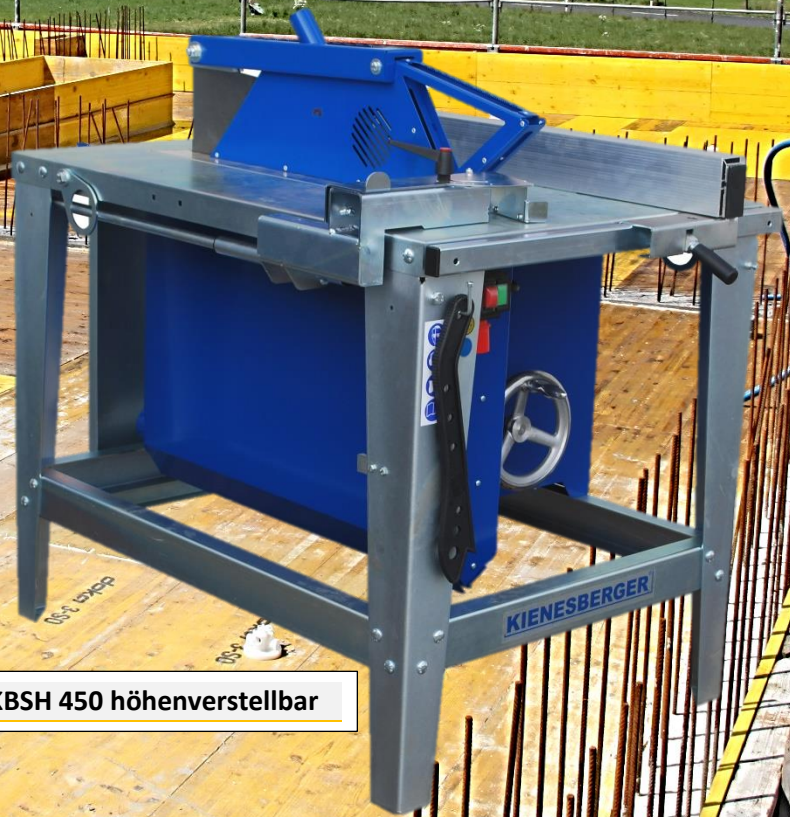
Abb. KBSH 450 höhenverstellbar