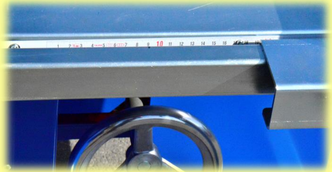
Abb. Masstab bei allen Typen

Hochwertige - wartungsfrei Baukreissäge für den Profi KIENESBERGER Baukreissägen erfüllen alle Sicherheitsbestimmungen. Robuste Bauweise und Verzinkung der Baukreissägen sind Voraussetzung für eine lange Lebensdauer.