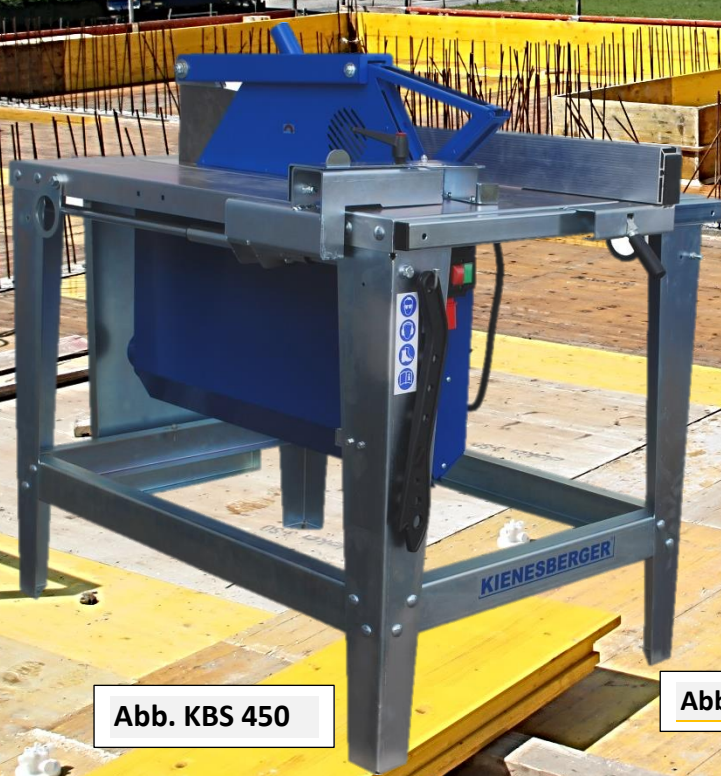
Abb. KBS 450